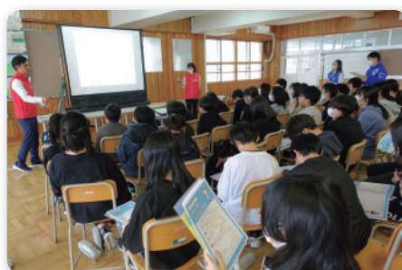
◆ 金融リテラシー開催 (令和5年9月14日～令和6年3月8日実施)