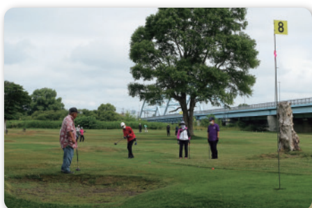
◆ 第8回きたしんパークゴルフ大会 (令和5年7月7日実施)