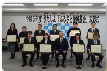
◆ ふるさと振興基金表彰式 (令和6年3月19日実施)