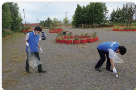
◆ 第24回クリーン運動 (令和5年6月23日実施)