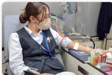
◆ 第21回献血運動 (令和5年6月1日実施)